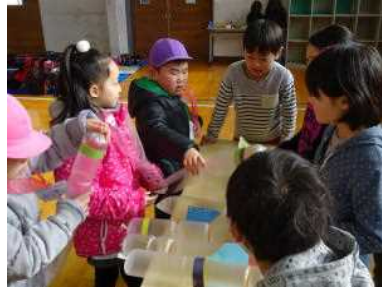
2年生のなかよし交流会