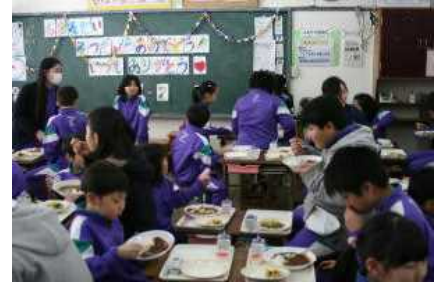
1・6年生のなかよし給食