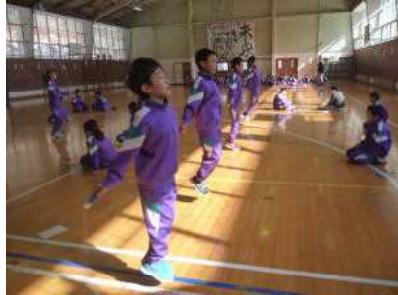
3・4年生のなわとび集会

なわとび集会は，1・6年生，2・5年生，3・4年生が一緒に行いました。みんな練習の成果を発揮してはりきって跳んでいました。なかよし給食は，1年生が入学してから今までお世話してくれた6年生への感謝の気持ちを込めて一緒に食べました。こども園との交流は，2年生が1年生と年長さんを招待して生活科で作ったおもちゃで一緒に遊びました。来年度もこのような異年齢交流を行ってまいります。